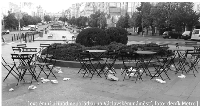
[extrémní případ nepořádku na Václavském náměstí]