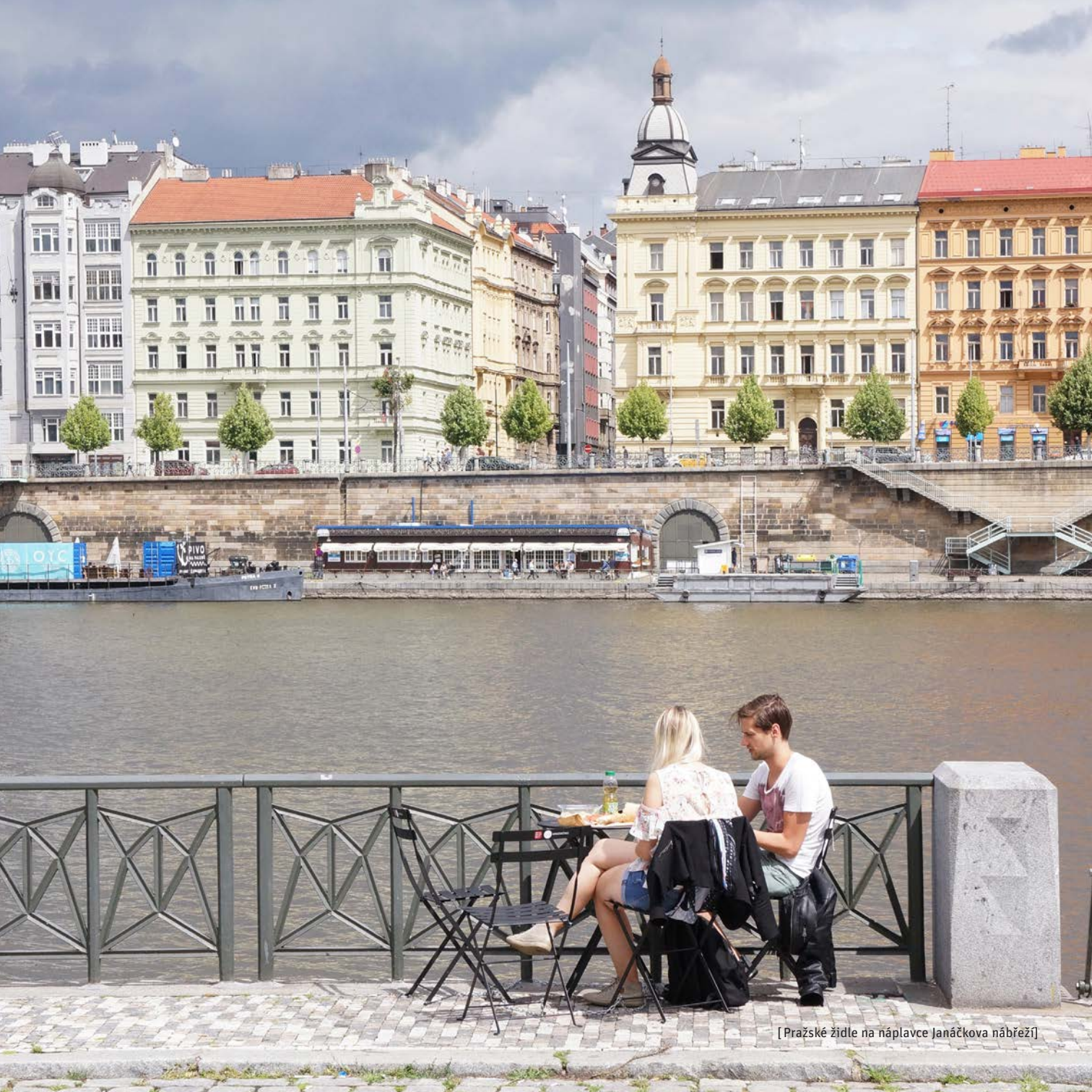
[Pražské židle na náplavce Janáčkově nábřeží]