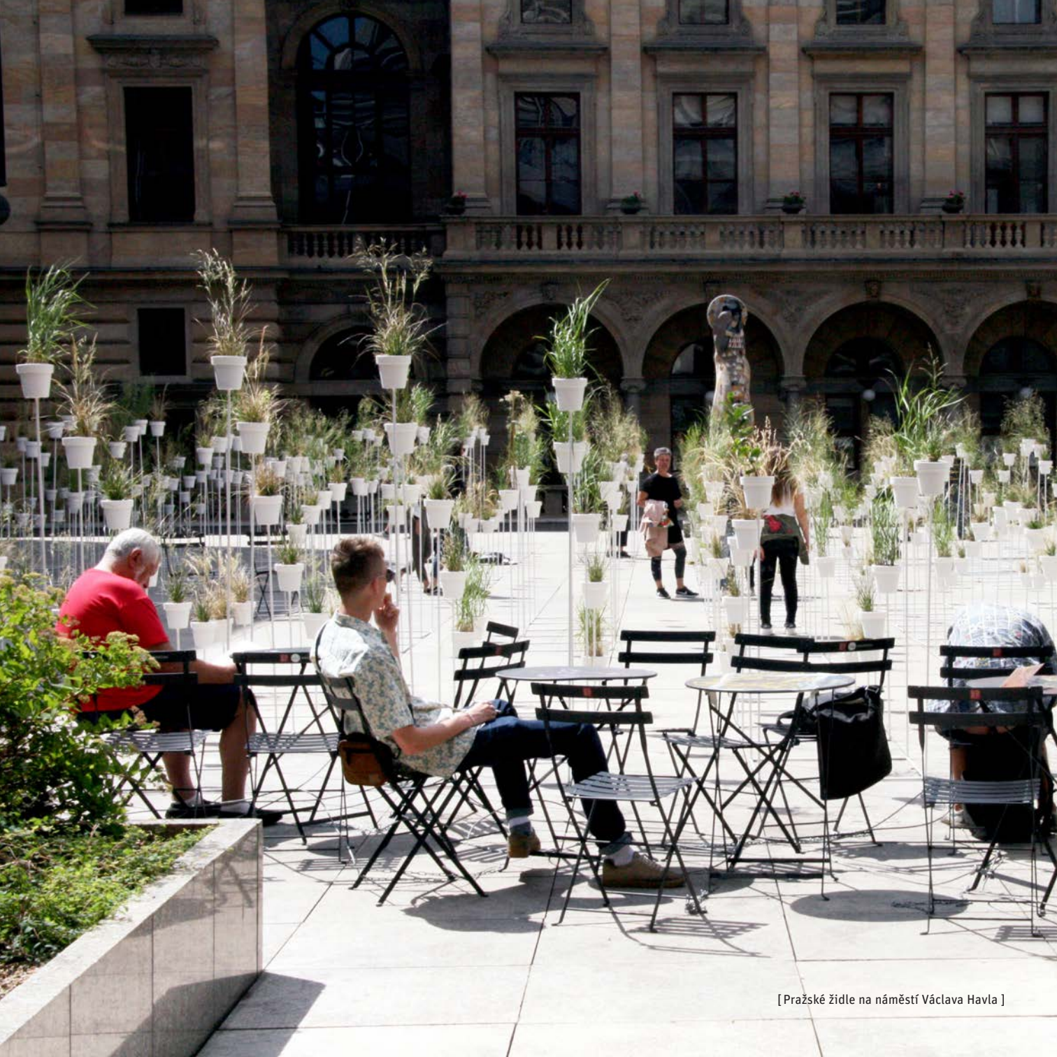
[ Pražské židle na náměstí Václava Havla ]