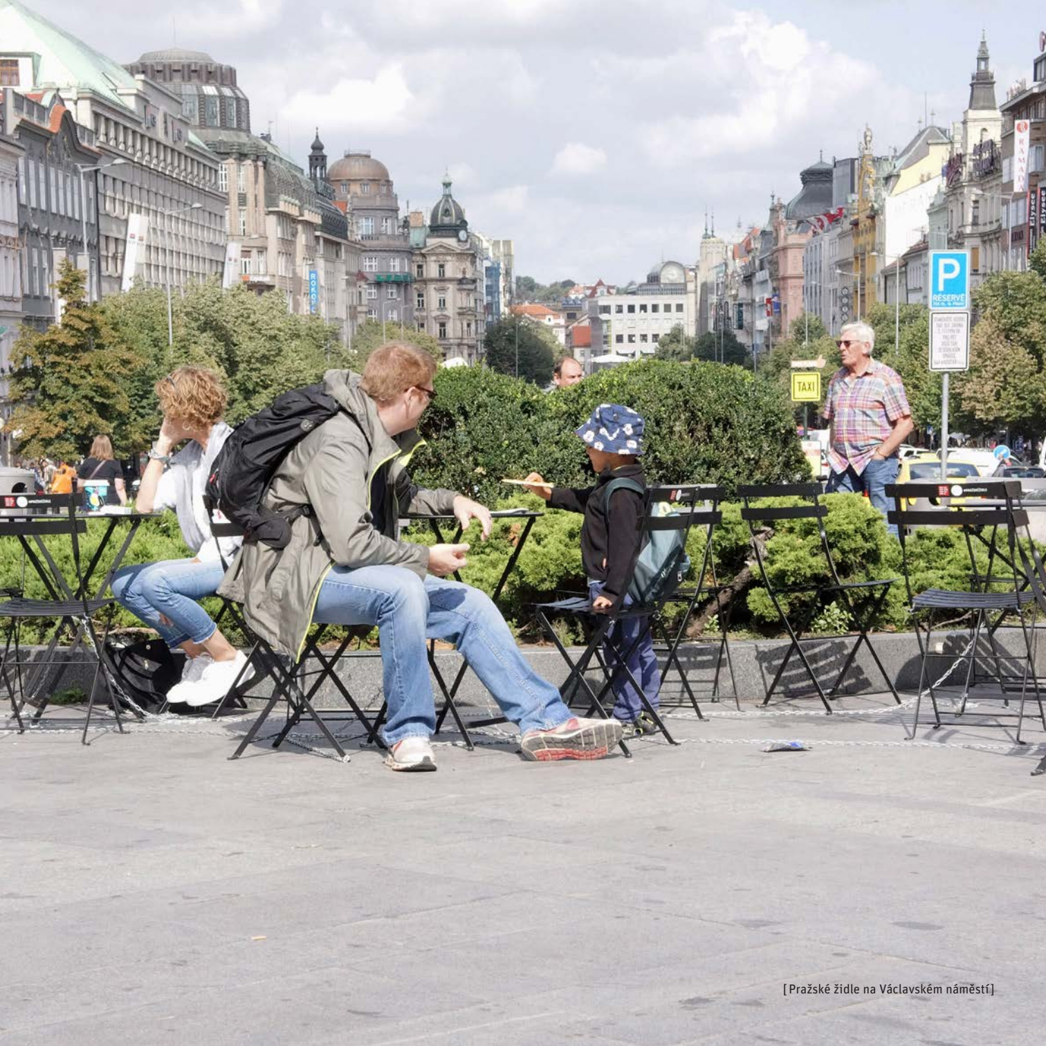
[Pražské židle na Václavském náměstí]