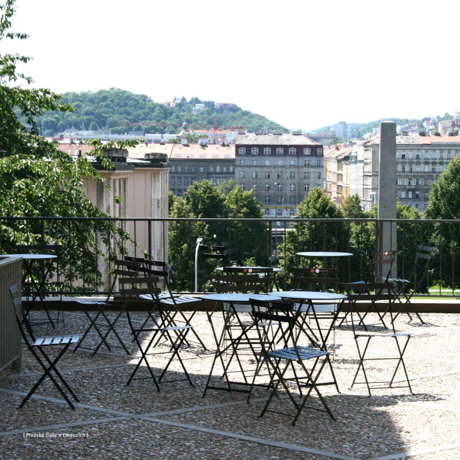
[ Pražské židle v Emauzích ]